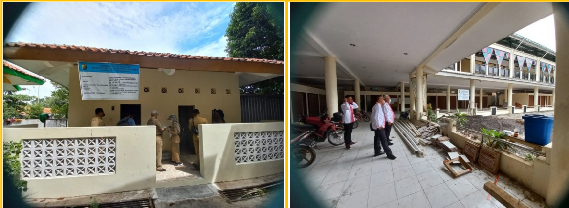
Foto Pemeliharaan bangunan pasar-pasar sekota