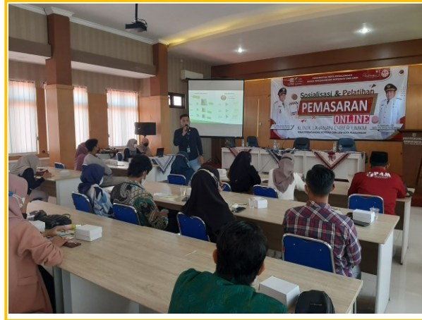
Kegiatan pelatihan dan bimbingan regulasi bisnis Internasional dan peningkatan produk ekspor

Pencapaian sasaran 3 dapat dilihat dalam tabel dibawah ini :