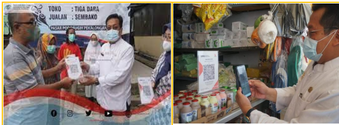
Foto Penggunaan QRIS & E-Retribusi di Pasar Rakyat

Pencapaian sasaran 4 dapat dilihat dalam tabel dibawah ini :